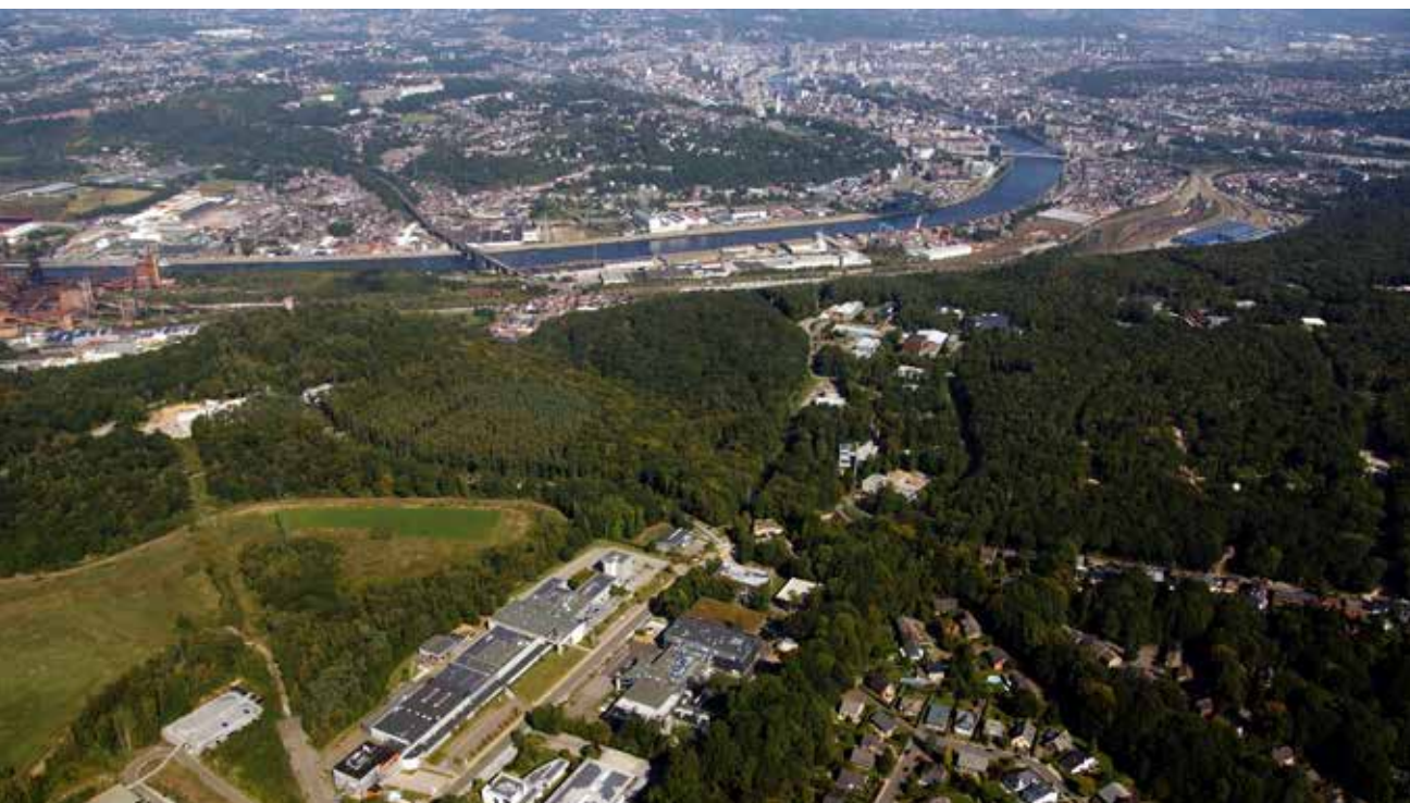
Liège Science Park

Avec l'horizon du « stop béton », Spi devra sélectionner les projets à externalités positives pour le territoire et être un moteur d'innovation dans les solutions foncières et immobilières proposées. En effet, le choix des différents projets au sein des espaces à vocation économique sera décisif pour initier une trajectoire innovante et durable, tout en laissant la porte ouverte à des hypothèses de réindustrialisation porteuses pour la province.