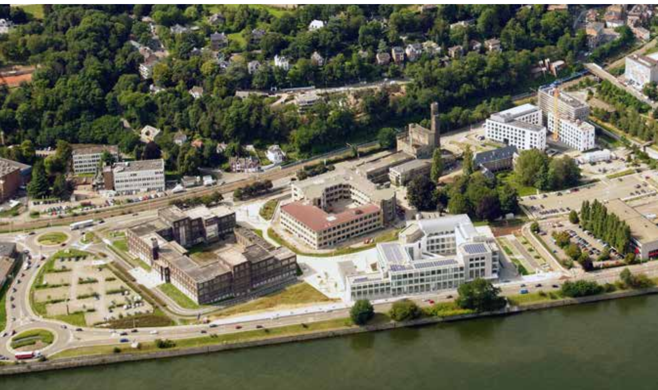
Liège - Val Benoit

En parallèle, vu la profonde transformation du modèle énergétique dans le court et moyen terme, et les objectifs bas carbone (qu'ils soient européens ou régionaux), il est nécessaire de faire prendre conscience aux entreprises et collectivités dans la dynamique de leur responsabilité sociétale et en les accompagnant sur ce point. L'évolution des législations, la taxonomie européenne et l'éligibilité aux financements conditionnée à des modèles durables rend nécessaire pour Spi de proposer des services d'accompagnement permettant une évolution du modèle économique des entreprises et des infrastructures qui les entourent, c'est-à-dire les parcs d'activité économiques. Il s'agit aujourd'hui d'une condition nécessaire pour rendre le territoire compétitif/attractif pour les investisseurs, exemplaire pour les générations futures et pour permettre aux entreprises de s'y développer.